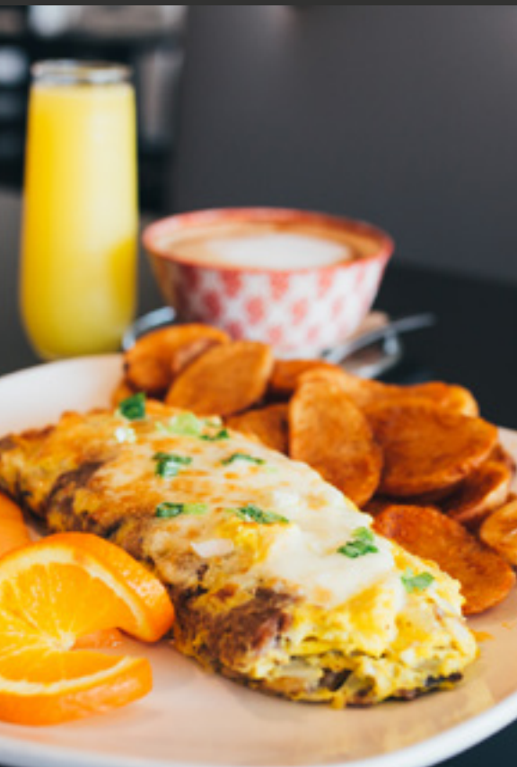
L'Omelette Philly extra gratinée