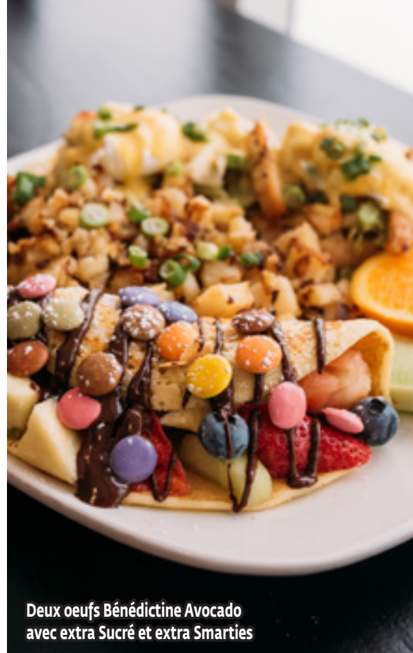
Deux oeufs Bénédictine Avocado avec extra Sucré et extra Smarties