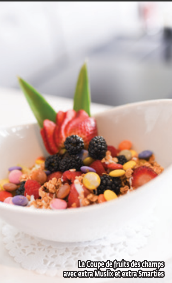
La Coupe de fruits des champs avec extra Muslix et extra Smarties