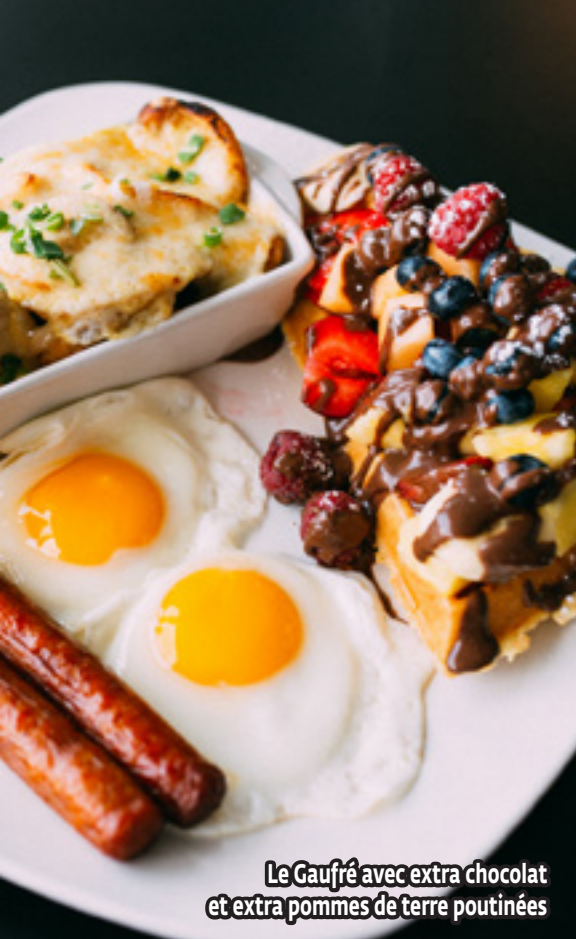
Le Gaufré avec extra chocolat et extra pommes de terre poutinées