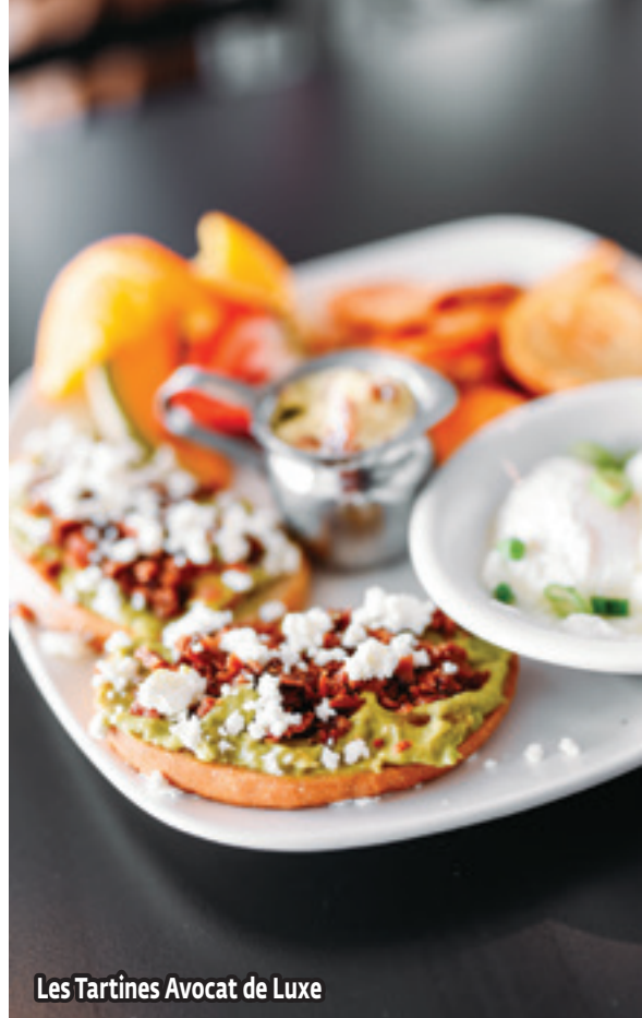
Les Tartines Avocat de Luxe