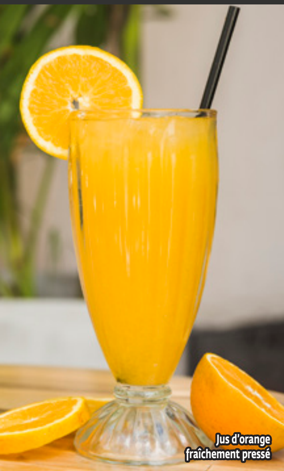
Jus d'orange fraîchement pressé