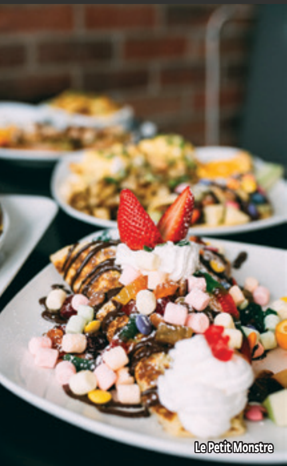
Le Petit Monstre