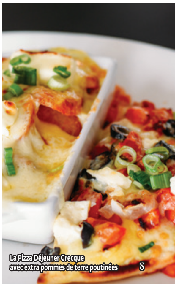
La Pizza Déjeuner Grecque avec extra pommes de terre poutinées