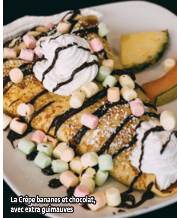
La Crêpe bananes et chocolat, avec extra guimauves