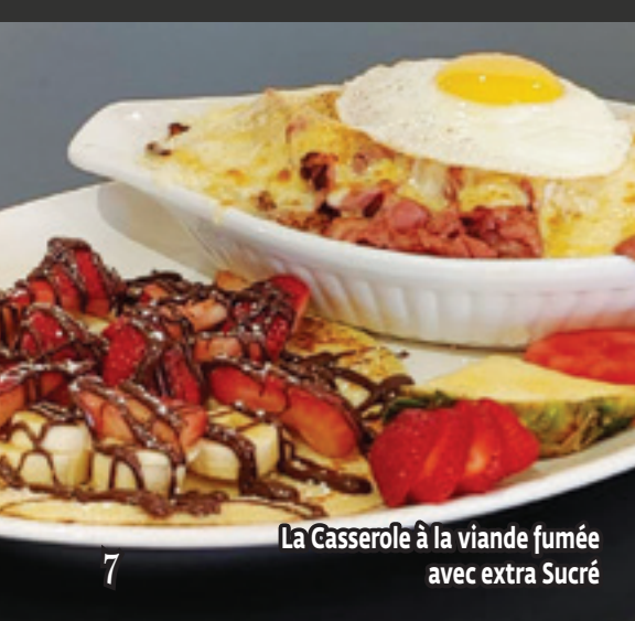
La Casserole à la viande fumée avec extra Sucré