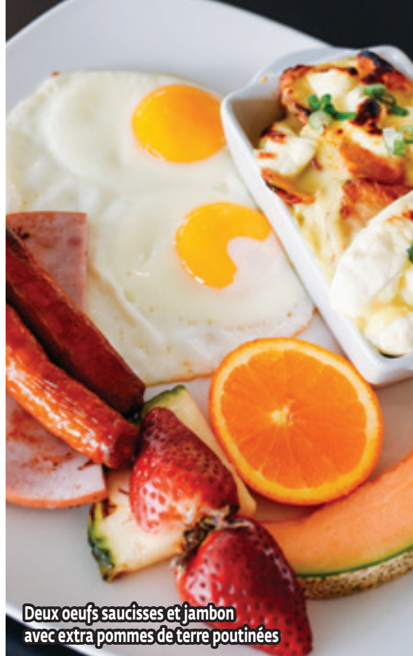
Deux oeufs saucisses et jambon avec extra pommes de terre poutinées

Deux œufs, bacon, jambon, saucisses, creton, fèves au lard, pain doré et crêpe nature. . . . . 19,95