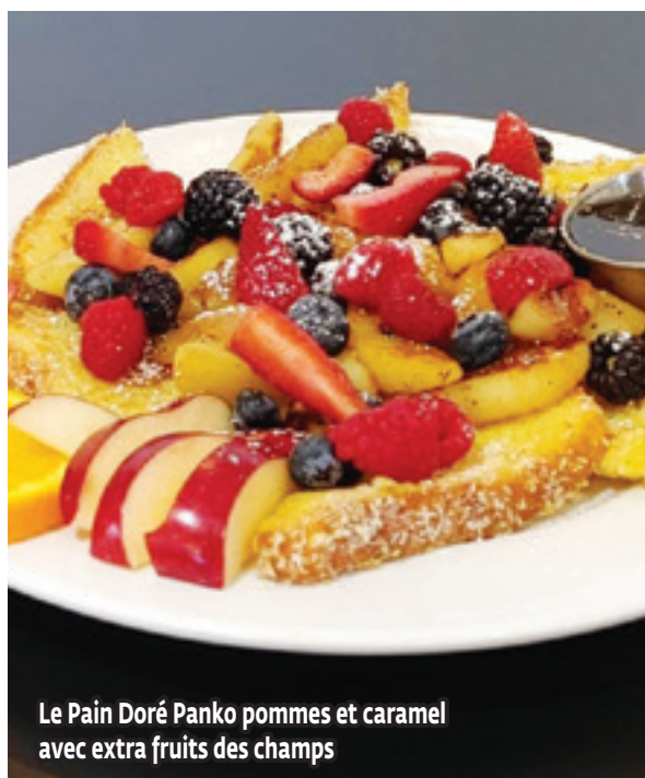
Le Pain Doré Panko pommes et caramel avec extra fruits des champs