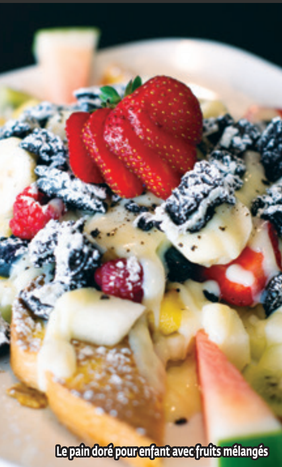
Le pain doré pour enfant avec fruits mélangés