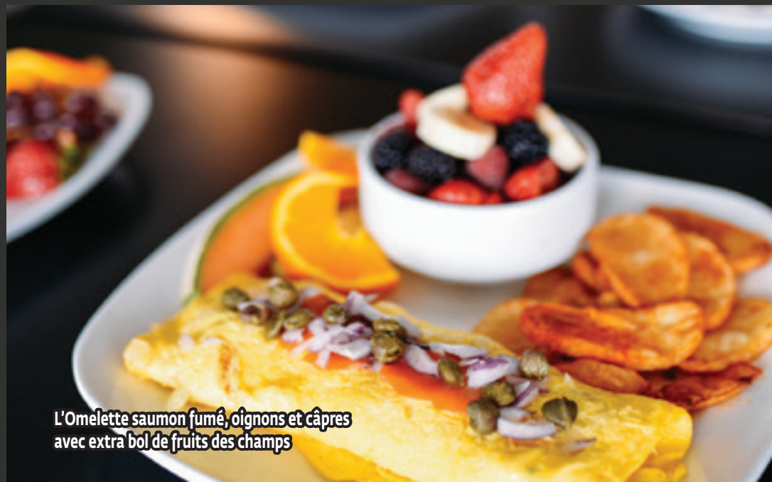
L'Omelette saumon fumé, oignons et câpres avec extra bol de fruits des champs