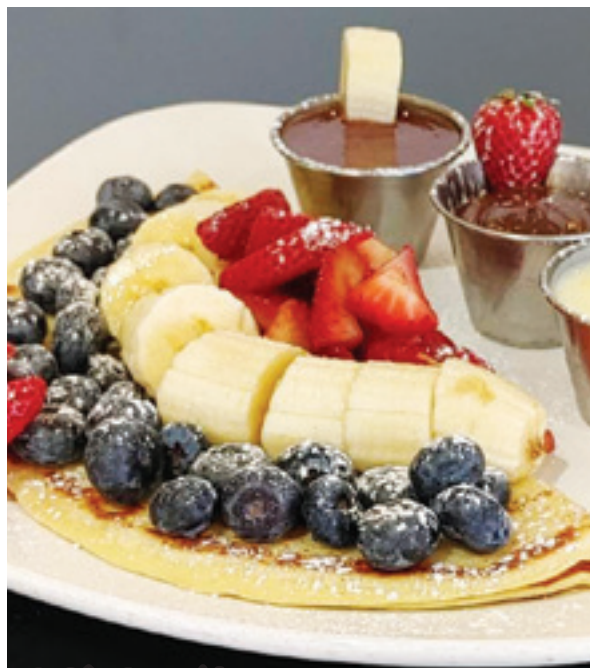
La Crêpe Arc-en-ciel