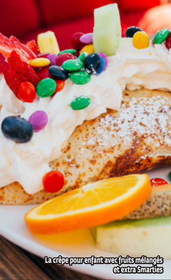
La crêpe pour enfant avec fruits mélangés et extra Smarties