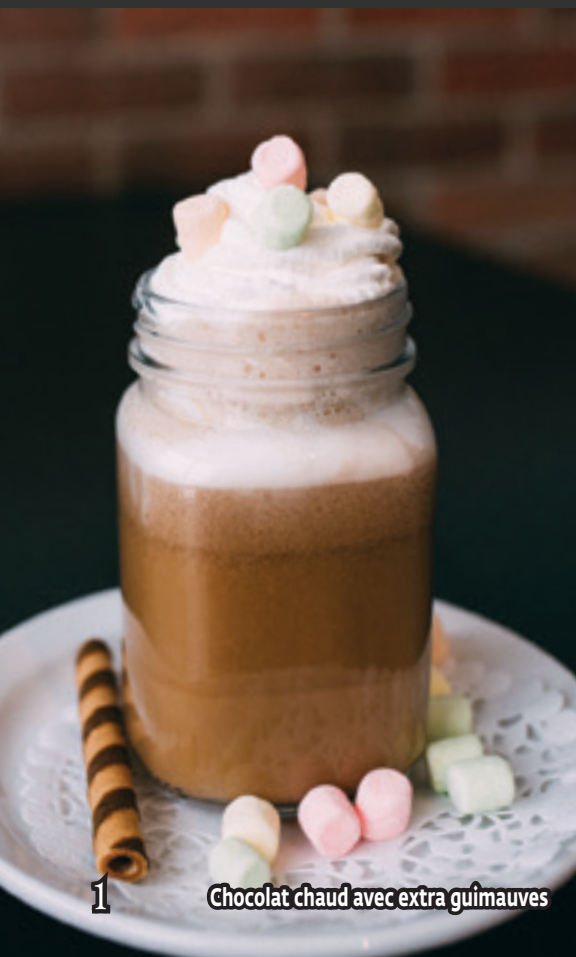
1 Chocolat chaud avec extra guimauves