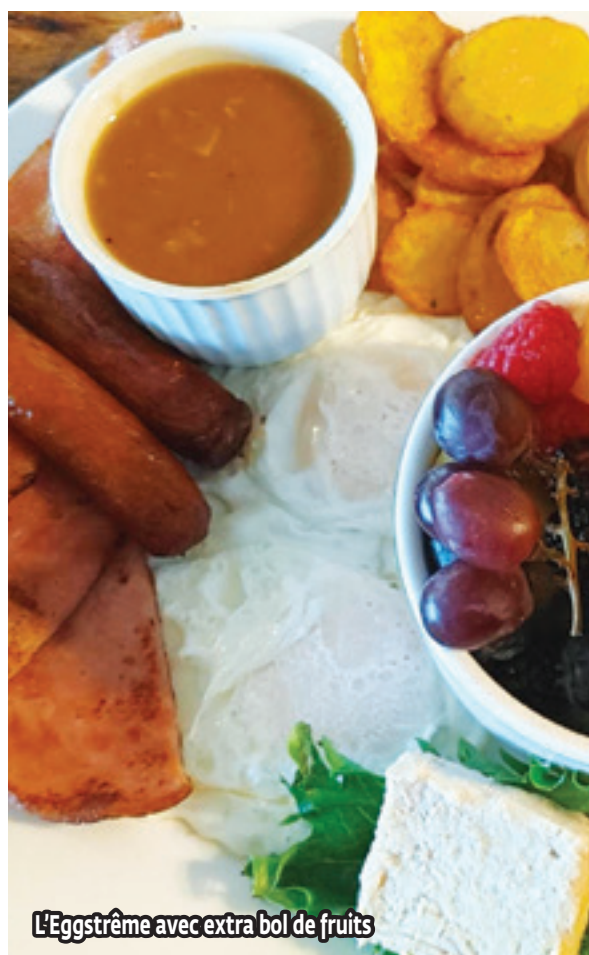
L'Eggstrême avec extra bol de fruits