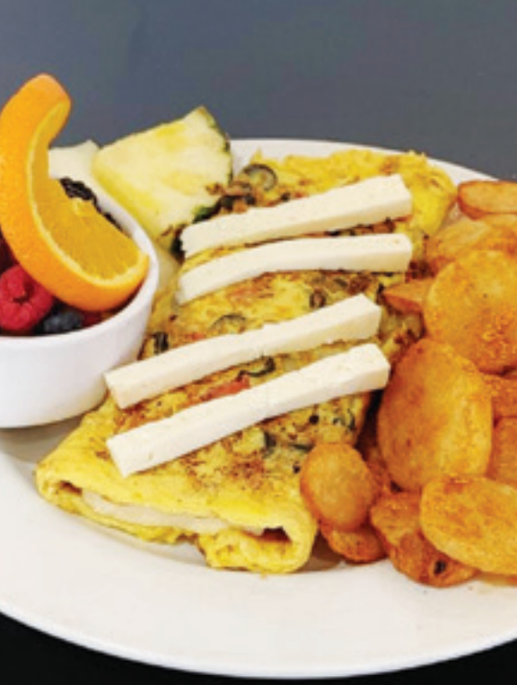
L'Omelette Haloumi avec extra bol de fruits des champs