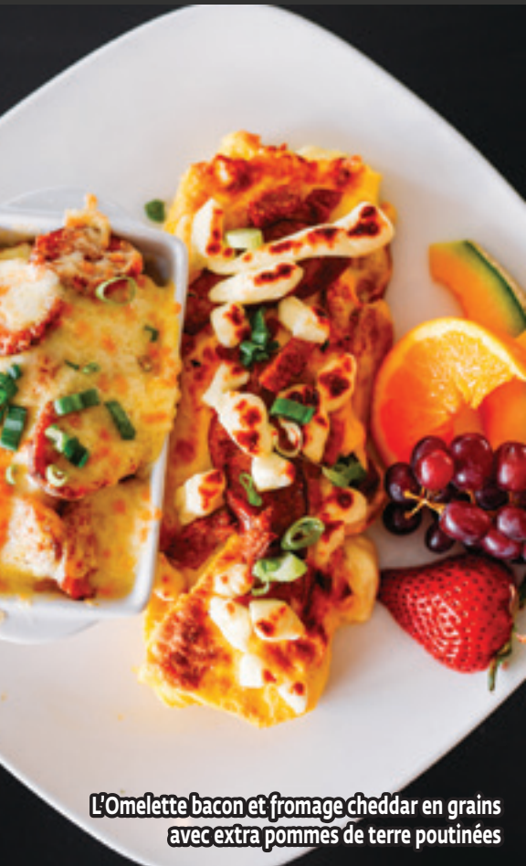
L'Omelette bacon et fromage cheddar en grains avec extra pommes de terre poutinées