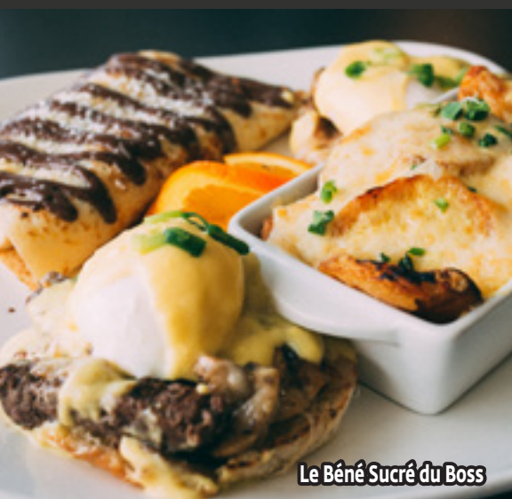
Le Béné Sucré du Boss

Deux oeufs Bénédictine au steak Philly, champignons, oignons et fromage cheddar râpé ou en grains avec une demi crêpe bananes-chocolat et pommes de terre maison poutinées (fromage cheddar râpé ou en grains et sauce hollandaise) . . . . . 22,95