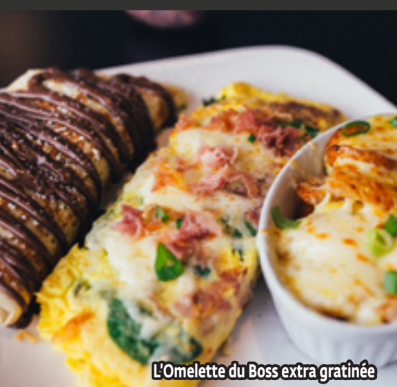
L'Omelette du Boss extra gratinée