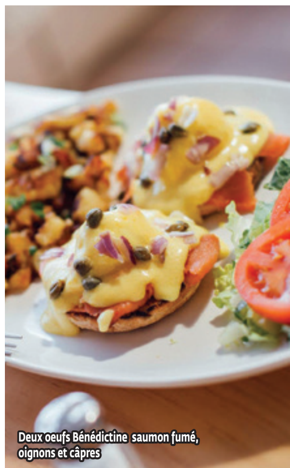
Deux oeufs Bénédictine saumon fumé, oignons et câpres