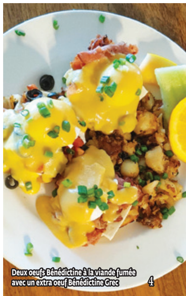
Deux oeufs Bénédictine à la viande fumée avec un extra oeuf Bénédictine Grec