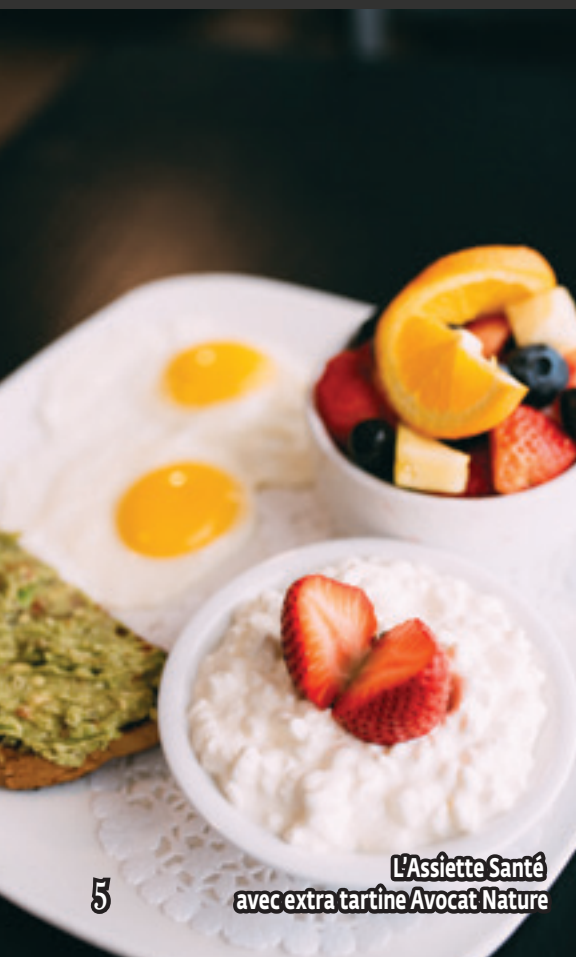
L'Assiette Santé avec extra tartine Avocat Nature

Avec fromage à la crème, oignons et câpres, servi avec choix de pommes de terre et café ..... 20,95