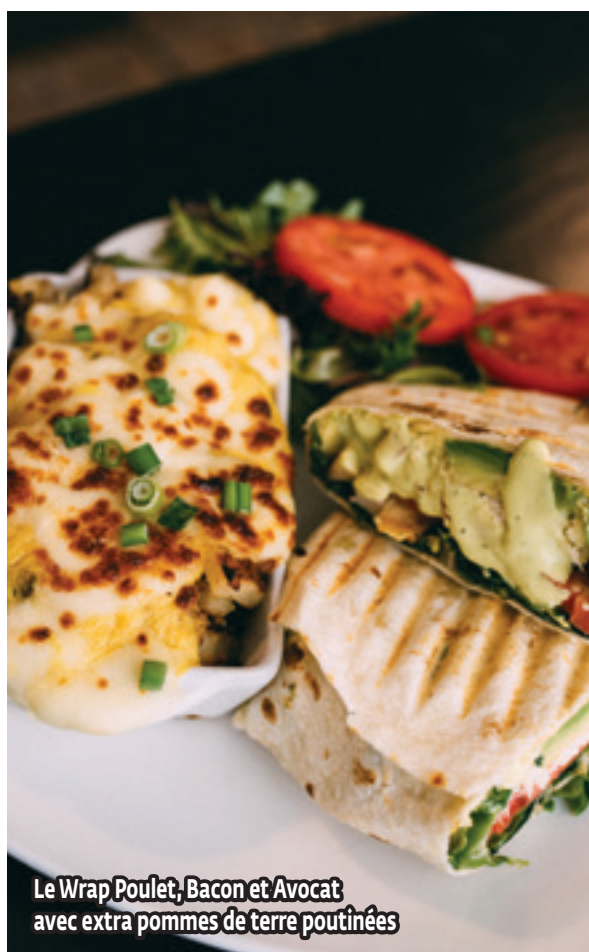
Le Wrap Poulet, Bacon et Avocat avec extra pommes de terre poutinées