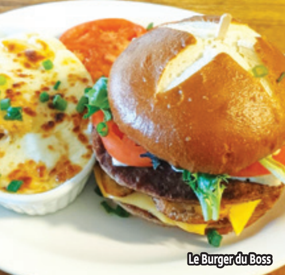
Le Burger du Boss